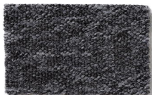
161 - Parati