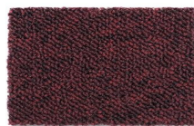
155 - Ubatuba