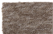
153 - Caiobá