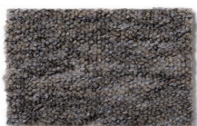
154 - Maragogi