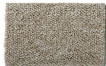
163 - Itaúnas