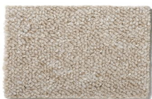
150 - Mariscal